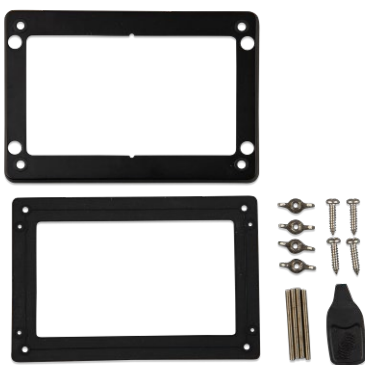
Accessoires inclus avec le GX Touch 50