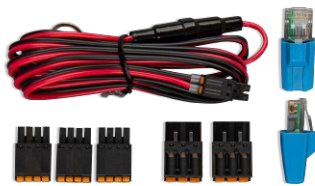
Accessoires inclus avec le Cerbo GX

Le Cerbo GX est facile à monter et peut aussi être monté sur un rail DIN à l'aide de l'adaptateur DIN35 small (non inclus). Son écran tactile séparé peut être boulonné sur un tableau de bord, éliminant ainsi la nécessité de réaliser des coupes exactes (comme avec le Color Control GX). Comme il se connecte facilement avec un seul câble, vous n'aurez pas à amener de nombreux fils jusqu'au tableau de bord. La fonction Bluetooth permet une connexion et une configuration rapides avec notre application VictronConnect.